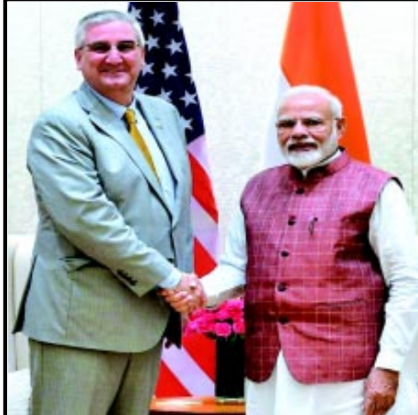
नई दिल्ली में प्रधानमंत्री नरेंद्र मोदी के साथ मुलाकात करते हुए इंडियाना के गवर्नर एरिक जोसेफ हालकोव्ज़।

विक्रम से संपर्क स्थापित करना काफी मुश्किल होगा। इसरो के एक अधिकारी ने नाम न उजागर करने की शर्त पर बताया कि इतने दिनों के बाद संपर्क करना बहुत ही ज्यादा मुश्किल होगा, लेकिन कोशिश करने में कोई दिक्कत नहीं है। इसरो अधिकारी के मुताबिक चांद पर रात के समय लैंडर को मुश्किल परिस्थितियों का सामना करना होगा। इस समय वहां काफी ज्यादा सर्दी होगी। इसके